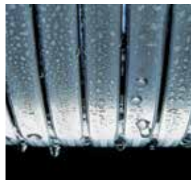
Echangeur de chaleur Inox-radial – durable et efficace