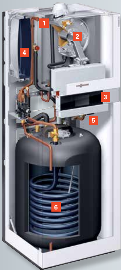
Vitodens 222-F avec réservoir d'eau chaude à serpentin émaillé (type B2SB) pour les régions où l'eau est dure